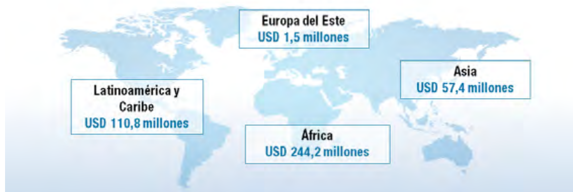
Figura 3.1. Aumento de los ingresos regionales reportados derivados de la asistencia IFSF al 30 de abril de 2018

Ingresos obtenidos reportados en 2017/18.