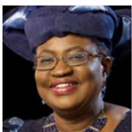
Ngozi Okonjo-Iweala (Ex - ministra de Hacienda de Nigeria)