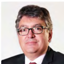
Mauricio Cárdenas Santa María

(Ministro de Hacienda y Crédito Público de Colombia)