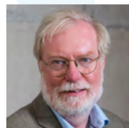
Sir Paul Collier (Profesor, Universidad de Oxford)