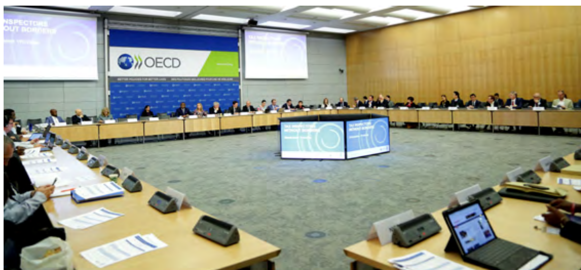
Figura 4.1. Mesa redonda de expertos y Taller de partes interesadas 2 y 3 de noviembre de 2017

El 2 de noviembre de 2017, se celebró en la OCDE una mesa redonda en la que expertos compartieron sus experiencias sobre los programas IFSF. Otros interesados de 28 países y 6 organizaciones internacionales y regionales se reunieron, el 3 de noviembre de 2017, en un taller de partes interesadas (ver Figura 4.1). A continuación, se presentan las principales observaciones efectuadas.